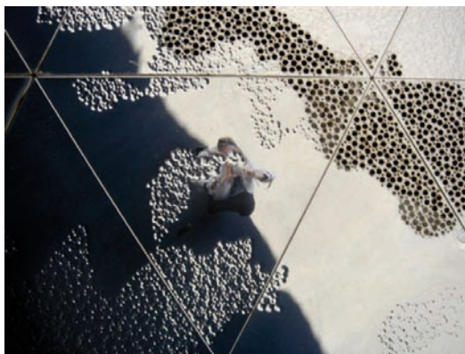
Traforazione architettonica Stampa lambda su alluminio, copertura in plexiglass.