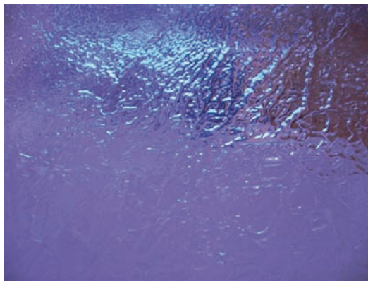
Ghiaccio-sequenza Stampa lambda su alluminio, copertura in plexiglass.

Le mie vedute, certe riprese di rocce, o della luce che attraversa un blocco di ghiaccio, sono le cose più immediate e sentite che ci comunicano la trepida sensibilità poetica, con cui dissimulo la mia tensione per afferrare una visione fuggevole, appena intravista, straordinariamente fusa con la natura, per trasformarla in stimolo a sottili sensazioni, come sottili e delicate sono le vibrazioni delle mie istantanee che ci inducono ad entrare in quel mio mondo di sensibilissima visione lirica.